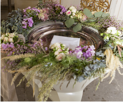
Taufstein in der Spitalkirche