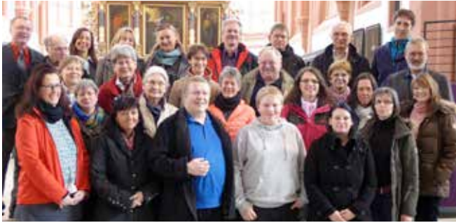
Das Team der ehrenamtlichen Kirchenführer/innen

Im März 2015 haben 26 engagierte Ehrenamtliche die Chance genutzt, in einer mehrmonatigen Ausbildung die frisch renovierte Stadtkirche und ihre Geschichte von allen Seiten genauer kennen zu lernen. Als Kirchenführer/in stehen sie nun für Führungen mit Gruppen zur Verfügung zum Beispiel für die öffentlichen Stadtkirchenführungen samstags 11 bis 12 Uhr. Für Orgelführungen, Familienführungen oder individuelle Führungen fragen Sie bitte im Pfarramt unter Telefon: 0921- 596800 nach.