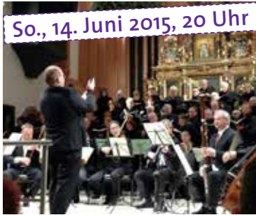
Ausschnitte aus dem Weihnachtsoratorium von Johann Sebastian Bach am 28. Dezember 2014