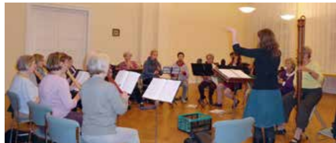
Flötenkreis im Löhehaus