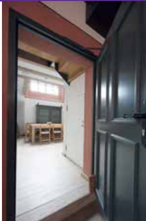
Eingang Michaelschor auf der Empore