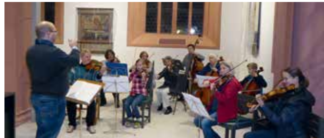
Probe für den Einweihungstag der Stadtkirche.