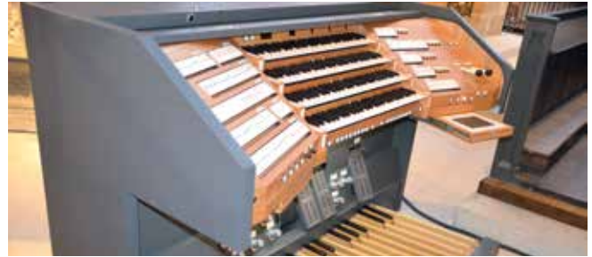
Vom neuen beweglichen Spieltisch im Chorraum kann auch die Hauptorgel gespielt werden.

Weitere Informationen über die Geschichte der Orgeln