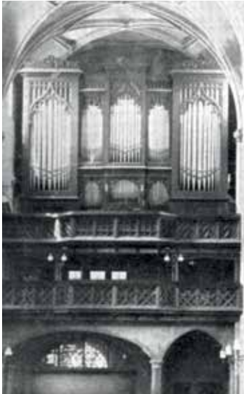
Die Tretzsch-Orgel von 1695 wurde mehrfach umgebaut, hier mit neugotischem Prospekt aus dem Jahr 1871

der Stadtkirche finden Sie im Festband „Auf den Tag.“